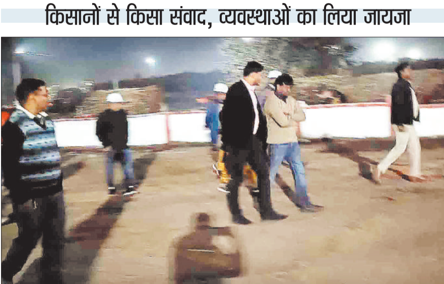
निरीक्षण करते कलेक्टर।

किसानों से किसान संवाद, व्यवस्थाओं का लिया जायजा