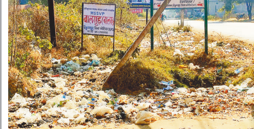
बैकुण्ठपुर। शहर सीमा में प्रवेश करने के पूर्व मुख्य मार्ग किनारे तलवापारा में महीनों से कचरे का ढेर पड़ा देखने को मिलता है। स्वच्छता के दावे यहां सिर्फ कागजों में ही है।